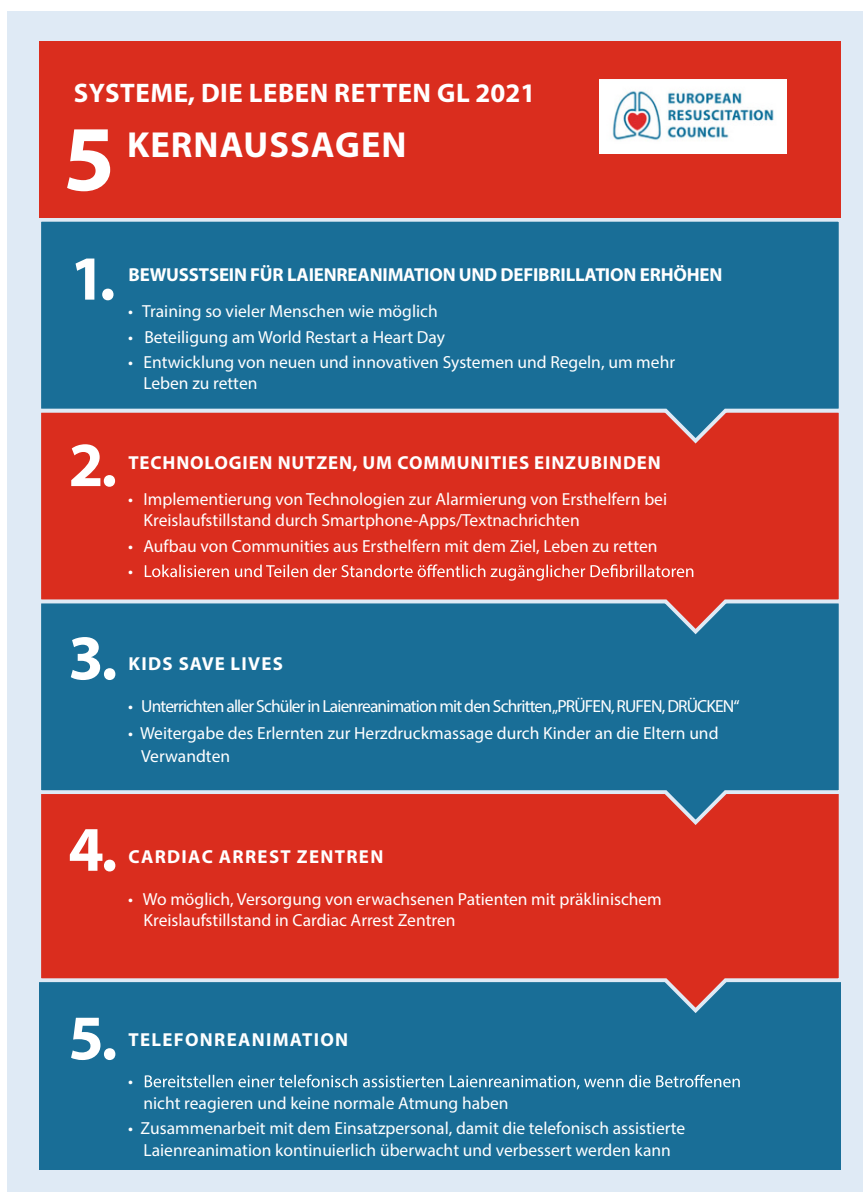
Abb. 1 ▲ Infografik Zusammenfassung lebensrettende Systeme

Das „Systems Saving Lives“-Konzept betont die Verbindung zwischen Bevölkerung und Rettungsdienst (z. B. KIDS SAVE LIVES) und soll in jedem europäischen Land implementiert werden. Lebensrettende Systeme reicht vom jungen Schüler, der in der Schule HLW lernt, über einen Bürger, der über sein Mobiltelefon einen Kreislaufstillstandsalarm erhält und bereit ist, die HLW zu starten und vor Ort einen automatisierten externen Defibrillator (AED) zu verwenden, bis zum Rettungsdienstteam, das die ALS-Behandlung fortsetzt, um den Patienten für die Nachbehandlung in einem Hochleistungs Krankenhaus zu stabilisie-