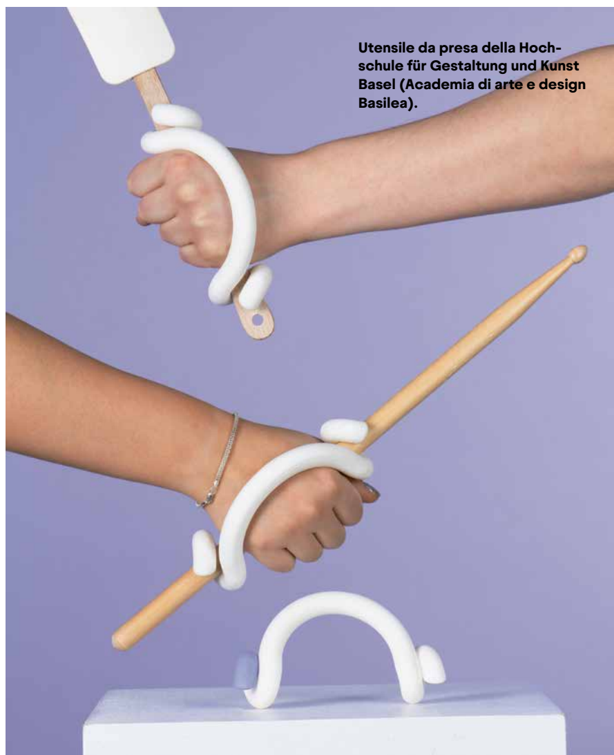
Utensile da presa della Hochschule für Gestaltung und Kunst Basel (Accademia di arte e design Basilea).

I progetti presentati saranno valutati da una giuria nazionale e in seguito da una internazionale. I vincitori potranno presentare le loro creazioni, incluso il business plan, al Comitato d'innovazione (Innovation Board) della Fondazione svizzera per paraplegici, auspicando di ottenere il sostegno finanziario per realizzarle. «Tra i prodotti presentati, alcuni potrebbero davvero migliorare la vita delle persone con lesione midollare», afferma soddisfatto Ulrich Kössl. (gasc)