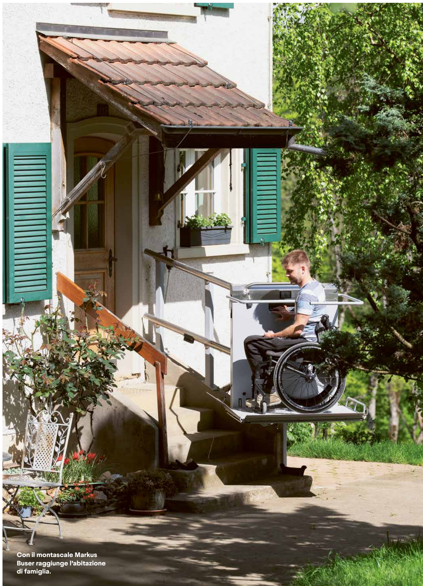
Con il montascale Markus Buser raggiunge l'abitazione di famiglia.