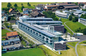
Eröffnung des Guido A. Zäch Instituts (GZI). Rücktritt als SPZ-Direktor.