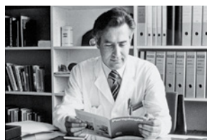
Erstausgabe «Paraplegie», Chefredaktor bis 2007.