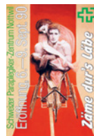
Eröffnungsfest mit 150 000 Besuchenden, Inbetriebnahme des SPZ.