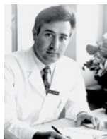
Chefarzt des Schweizerischen Paraplegikerzentrums in Basel.