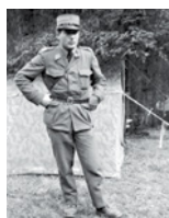
Er wird Major (1975), Kommandant der Sanitätsoffiziersschule (1981) und Oberst der Sanitätstruppen (1987).