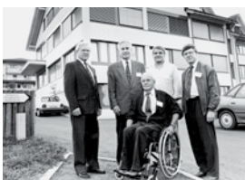
Gründung der Schweizer Paraplegiker-Vereinigung, Präsident bis 2000.