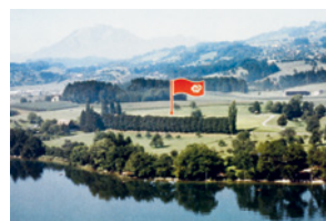
Die Ernst Göhner Stiftung stellt in Risch kostenlos Bauland für die Spezialklinik zur Verfügung.