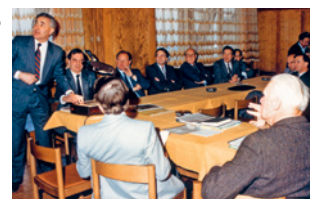
Nottwil sagt Ja zur Umzonung von Industrieland in eine Zone für klinische und therapeutische Zwecke.