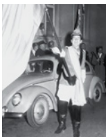
Studium in Genf, Wien und Paris. Praktikum am Kantonsspital St. Gallen.