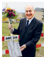
Gründung der Schweizer Paraplegiker-Forschung.