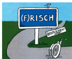
Ablehnung des Paraplegiker-Zentrums in Risch ZG. Guido A. Zäch wird Grossrat des Kantons Basel-Stadt.