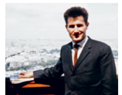
Medizinisches Staats- examen in Basel.