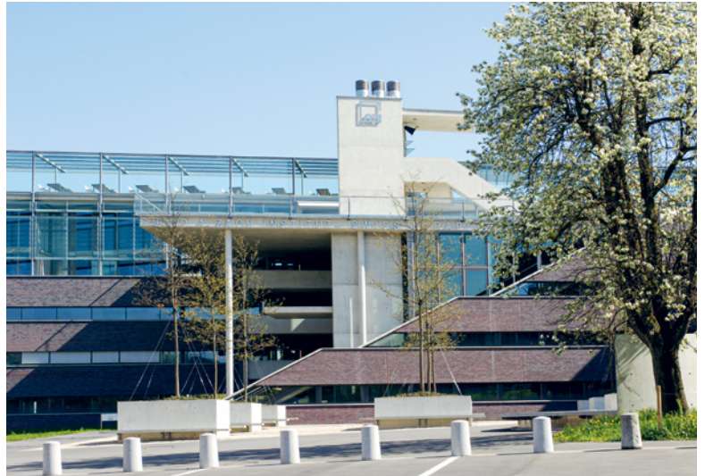
2005 wird das Guido A. Zäch Institut für Klinische Forschung eröffnet.

Gymnasiast besucht er zwei Jahre die Klosterschule Engelberg. Aber er weiss bald, dass er nicht Theologie studieren will, sondern Medizin. Er will Sinnvolles leisten. Als Student verkauft 1956 seine Solidaritätsgruppe Weihnachtskerzen für die Flüchtlinge aus Ungarn. Das Ziel sind dreissig Kerzen – er verkauft tausend und sagt: «Ich hatte offenbar die Gabe, Menschen von einer guten Sache zu überzeugen.»