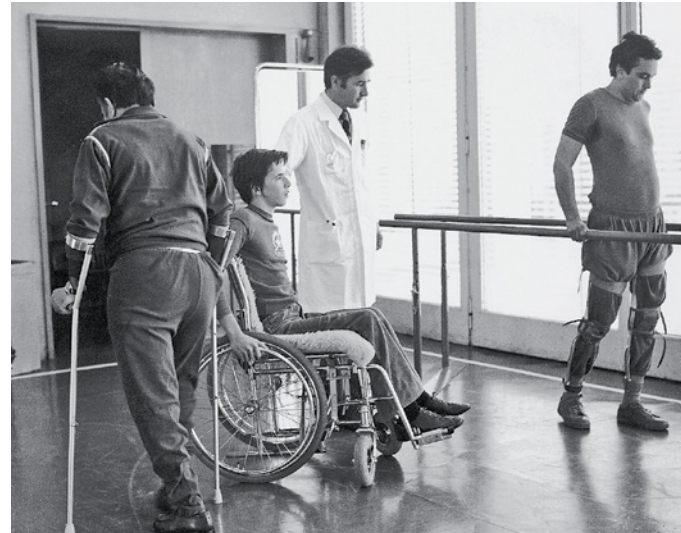
Therapiesaal im Schweizerischen Paraplegikerzentrum in Basel.

Europa. Er will insbesondere die Effizienz der Behandlung steigern. «Das Richtige rechtzeitig richtig tun» ist sein Leitspruch: «In der Akutphase die fachkundige Erstbehandlung mit nahtlosem Übergang in die ganzheitliche Rehabilitation sowie in die gesellschaftliche und berufliche Eingliederung.»