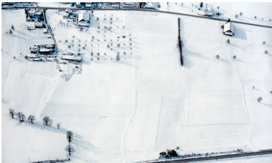
Le terrain à bâtir enneigé : le Centre suisse des paraplégiques a été construit entre la route cantonale et la ligne de chemin de fer.

Après une durée de construction de trois ans, le Centre suisse des paraplégiques (CSP) ouvre ses portes à la popu-