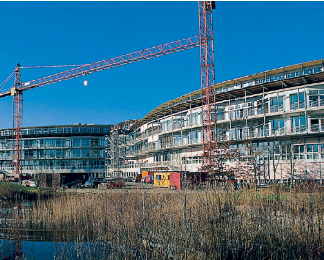
Les travaux d'extension de la clinique en 2003.