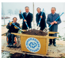
Lancement des travaux pour le Centre suisse des paraplégiques à Nottwil.