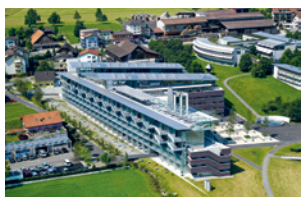
Ouverture de l'Institut Guido A. Zäch (GZI). Démission en tant que directeur du CSP.