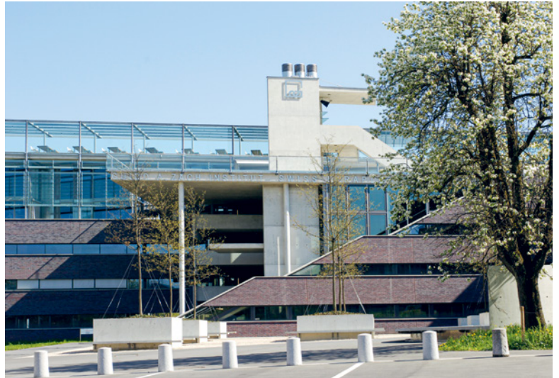
2005 voit l'inauguration de l'Institut Guido A. Zäch pour la recherche clinique.

biographe Trudi von Fellenberg-Bitzi les coups de main qu'il donnait à sa voisine pour 50 centimes la journée.