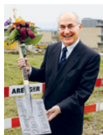
Fondation de la Recherche suisse pour paraplégiques.