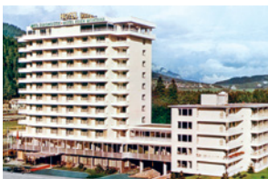
Mise en place du centre pour le diagnostic médical à Ilanz (GR) en tant que médecin-chef.