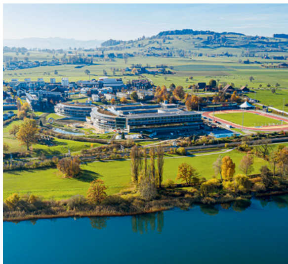
Le Centre suisse des paraplégiques en 2021 après les travaux d'extension les plus récents.