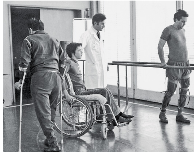
Salle de thérapie au centre pour paraplégiques à Bâle.

intégrale ainsi que vers l'insertion sociale et professionnelle. »