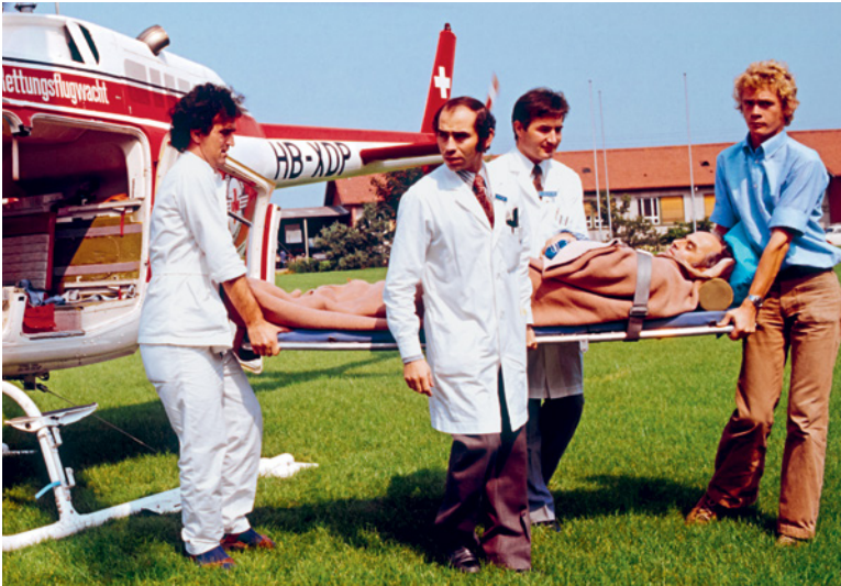
Des lieux de l'accident directement au centre pour paraplégiques : l'hélicoptère de la Rega sur le terrain d'atterrissage provisoire.