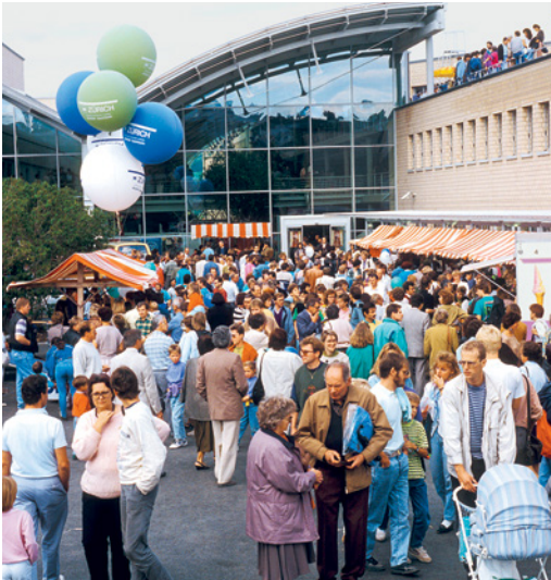
En 1990, plus de 150 000 personnes se sont déplacées pour l'inauguration du CSP.