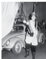
Studi a Ginevra, Vienna e Parigi. Tirocinio presso l'Ospedale cantonale a San Gallo.