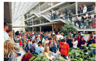
Fondazione di SIRMED e di ParaHelp. Inaugurazione delle nuove strutture di ampliamento. Dimissione dal Consiglio nazionale.