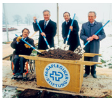
Avviati i lavori di costruzione del Centro svizzero per paraplegici di Nottwil.