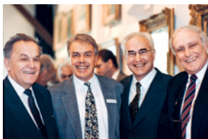
Conferimento del premio Hirzel-Callegari. Dimissione quale primario del CSP.