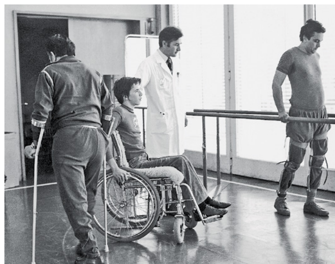
La sala terapie del Centro per paraplegici di Basilea.

riabilitazione globale e il reinserimento socio-professionale».