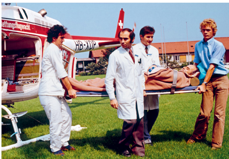
Dal luogo dell'infornuto direttamente al Centro per paraplegici: l'elicottero della Rega sulla piattaforma di atterraggio provvisoria.