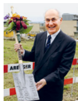
Fondazione della Ricerca svizzera per paraplegici.