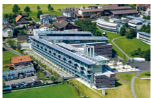
Inaugurazione dell'Istituto Guido A. Zäch (GZI). Dimissione quale primario del CSP.