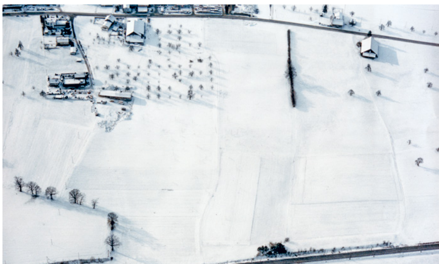
Terreno edificabile immerso nella neve: il Centro svizzero per paraplegici è sorto tra la strada cantonale e la linea ferroviaria.