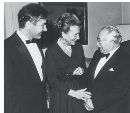
Invito alla tenuta Aabach a Risch (ZG) in occasione del conferimento del titolo di Dottore honoris causa dell'Università di Basilea (1976): il premiato Sir Ludwig Guttman (a destra) e Guido A. Zäch, che aveva promosso la sua nomina, sono ospiti di Silvia Göhner-Fricsay.