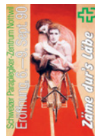
Festa di inaugurazione con 150 000 visitatori: entra in funzione il CSP.