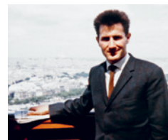
Esame federale in medicina a Basilea.